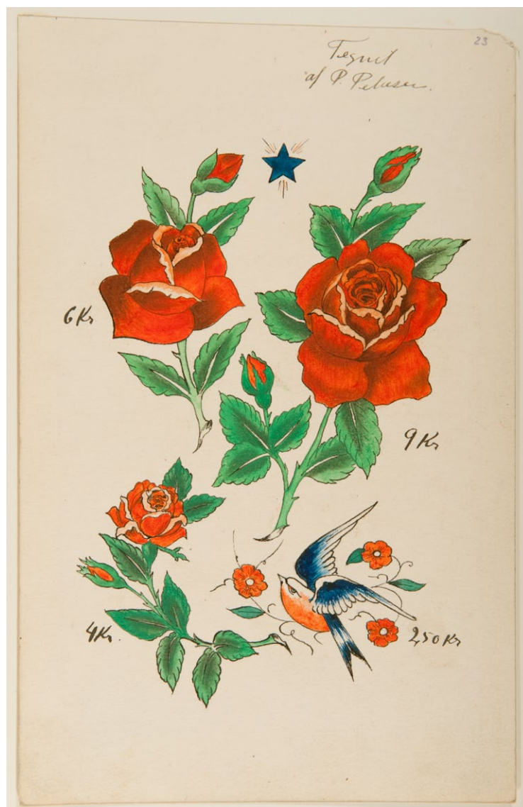
Tatueringsförelagor med pris och tatuerarens namn utskrivet.

Här följer 4 grupper av olika tatueringsförelagor. Det var samlingar på bilder som sjömän och andra kunde välja sin tatuering ifrån.