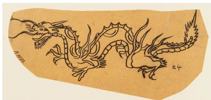
A3983 i vänsterkanten är stencilens nummer i museets samling.

Siffrorna med ett A framför är föremålsnumret i museets samling